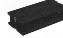
アシストスツール (品番:ASS-V) (写真3)