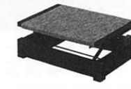
ワンタッチ式又は ダイヤル式足台 (写真2)