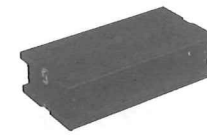
アシストスツール (品番:ASS-V) (写真3)