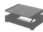
ワンタッチ式又は ダイヤル式足台 (写真2)